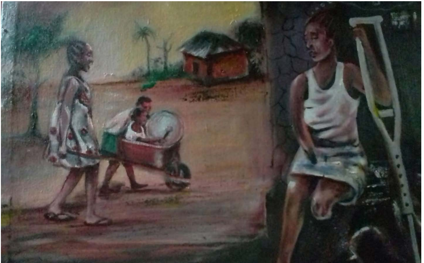
Projet artistique de CADEC dans le cadre du concours CoMo pour marquer le lancement de la feuille de route mondiale de l'OMS pour vaincre la méningite.